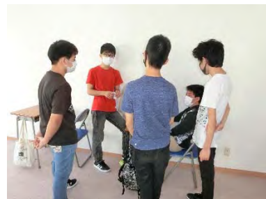
生徒同士も久々の再会。 でも近づきすぎないでね

今回、テストを実施した目的は あなた自身に取り組んできた勉強の成果を測る ということです。つまり、点数という結果だけにこだわるのではなく、自分が頑張って勉強して「できるようになったこと」が何で、「できなかったこと」が何であるのかを見つけることです。