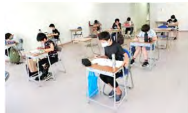
中1生にとっては、初めての5科目テスト！

塾中間テストは、久しぶりに塾へ来てもらいました。何よりも生徒たちの元気な姿が見られたことが本当に嬉しい！！ハイタッチや握手をしたい気持ちをおさえつつ、「 久しぶり～！元気やったかー！！ 」と生徒たちとの再会でしたね。