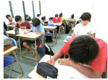
夏期講習での中3生の様子。みんな真剣に取り組んでいます。