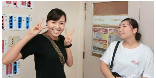
左側がお姉さん。26歳と22歳、もう立派な大人ですね！

二人とも同じ、公立のK高校に進学。中学生時代と比べると、当たり前ですが二人ともかなりお姉さんになっていました。