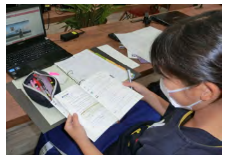
分かるまで何度も何度も繰り返す