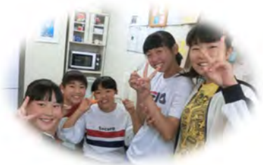
休憩時間、笑顔いっぱいの中3生