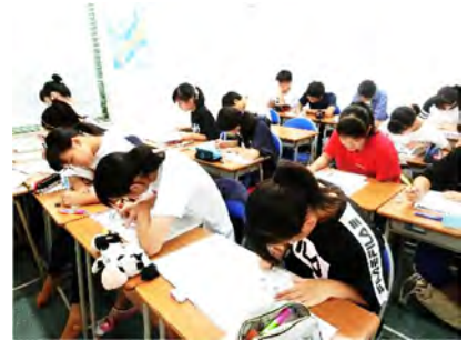
真剣に取り組んでいます！

どの学年も日ごとにテーマを決めて勉強に臨みましたが、 今回は、中3生の通い合宿の様子を報告します。