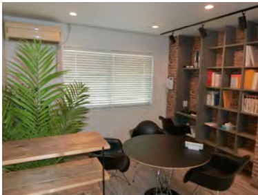
カフェのような落ち着いた雰囲気