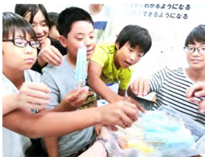
冷たいアイスで疲労回復！

今回の通い合宿は、中3生だけではなくありません。中1生や中2生も本当によく頑張りました。