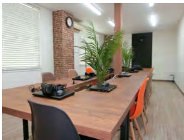
リラックスしながら勉強できる空間

9月18日(火)からついに高校部が開講いたしました！！ 「WILLで高校生もみて欲しい」というお声はたくさん頂戴して おりましたが、数多くの問題がありこれまでは開講に踏み