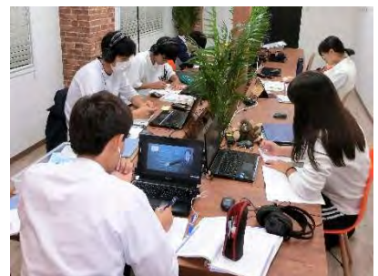
高校生の熱意がスゴイんです