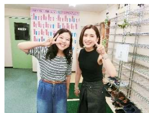
来年から社会人の二人

今回の来塾は、二人とも就職が決まったとのことで、報告しに来てくれました。二人とも来年から社会人なんですね。