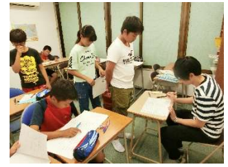
中1生の夏期講習の授業の様子

WILL では夏休みの間授業時間数が増えるのですが、更に夏期講習を受講すれば、日曜日を除いて毎日塾に来る生徒だっています。それでもほとんど欠席もなく、頑張って通塾してくれています。