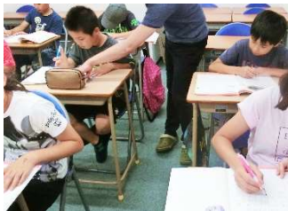
熱心に勉強に励む小学生たち

この夏休みのテーマは、「自分で勉強できるようになること」です。普段の授業で、教えてもらってできたことを、どれだけ自分の力でできるかが勝負。