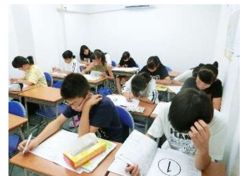
中2生の夏期講習の授業の様子

それは、「問題を1問でもたくさん解くこと」なのです。学力アップをするために大切なことは、「わかること」だけではないんです。わかったことを「できるようにする」ために、たくさん問題練習をして確実に「できるようになる」ことなんです。