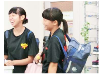
部活と塾の大きなバッグを抱えて塾に来る中3生。

補習は授業と全く同じことはできません。あくまで、部活などで授業に出られなかった生徒達のための補完でしかないということを決して忘れないでくださいね。