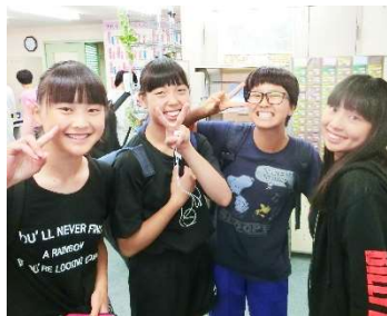
休憩時間、笑顔いっぱいの中3生

しかし、中3生の多くが頭を悩ませるのが、“部活”と“勉強”の両立一。受験生最大のテーマともいえるこの課題にどのように取り組むのか？