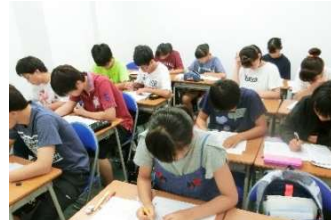
夏期講習での中3生の授業の様子