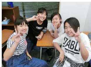
休憩時間の元気な生徒たちの様子

子どもたちは、結果がついてくるならどんなに辛いことでも頑張っようとするのです。「成績が上がる」「志望校に合格できる」から、頑張れるんです。