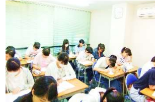
テスト勉強に励む生徒たち

スマホ、テレビ、マンガ、パソコン…。そのうえ、多くの子どもたちは自分の部屋をもち、ベッドがあります。つい横になって、ウトウトという経験は大人であっても同じことです。