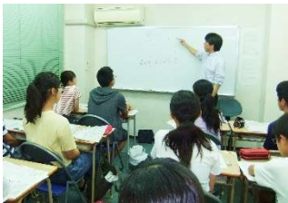
長時間の期末テスト対策 “WILL ぶっ期末”の様子

そうなんです。子どもも最低限の宿題は「しなければいけない」ことなのでやります。でも「した方がいい」と思うことは、やりたくても、誘惑に負けてしまうんです。