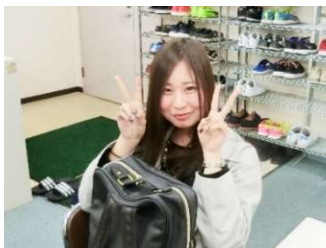
大阪J学院大に合格したO.Cさん