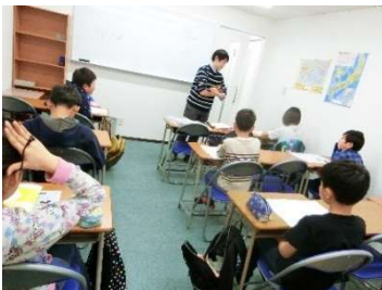
小学生の頑張りには目を見張るものがありました。今後に期待～！！

塾で習ったからと言って、学校の先生の授業をまともに受けなくなる、なんていうことは絶対にダメ！