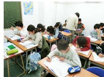
新中1生も頑張ってます！