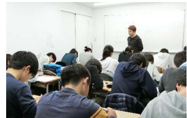
中3生の授業の様子。以前にもまして真剣さが伝わってきます。