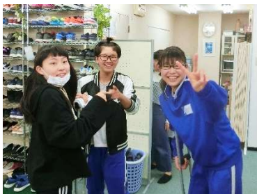
休憩時間の生徒たちの様子