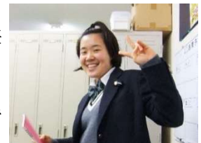
医学部目指して猛勉強中の

卒業生の皆さん、本当にありがとうございました。また、いつでも訪ねてきてくださいネ。