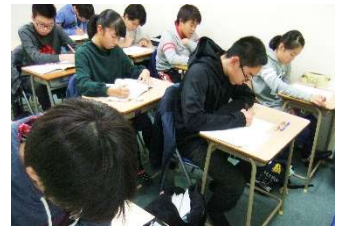
2学期“ぶっ期末”の様子 みんな真剣な表情で勉強しています。