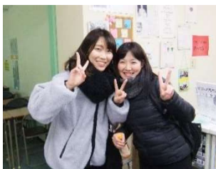
今年から堺市の中学校の先生。