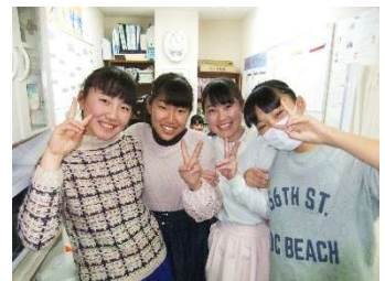
2学期“ぶっ期末”一休憩時間のひと時

そして、一般に取りにくいと言われている“学年末テスト”で、自分が納得する結果を出しましょうね。