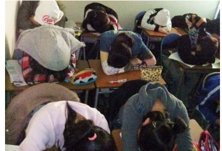
屋下がり、10分間のお昼寝タイム。熟睡している生徒もいました。

今回も相当量の提出物が課せられていましたが、ほとんどの生徒は前回“ピカ中”の時よりも、早く終えていました。