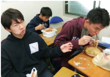
昼食のひととき。おいしそう～