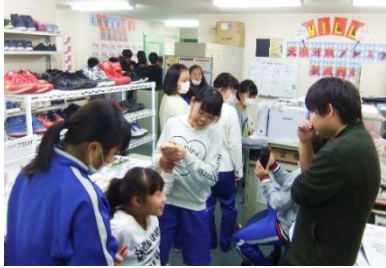
10分間の休憩時間、先生も生徒たちに囲まれて本当にリラックスしています。

「すごく成績が上がった生徒」（合計492点など480点以上が続出）もいますし、「あまり結果が良くなかった生徒」もいます。