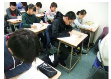
テスト勉強に励む中2生。

また、7の生徒も9や10の生徒もあまり点数が変わらず、ちょっとしたミスで7の生徒に9や10の生徒が負けてしまうこともあります。逆に2や3の生徒と5の生徒がほとんど点数が変わらず、とても低い点数になることもあります。