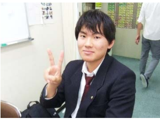
中学生の頃よりリラックスして、 すごくいい感じのI.T君