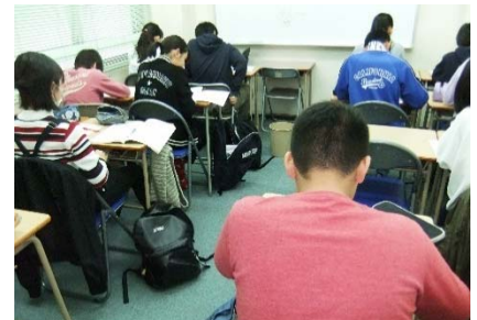
中1生も、長時間勉強にかなり慣れてきました。

もしもすべての生徒が、この「勉強の質」を今よりも高めることが出来れば恐らく、いや、絶対に、信じられないほど学力がついてくるんです。