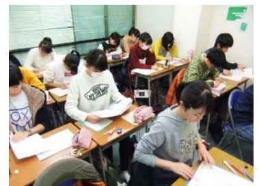
真剣にテスト勉強に励む中3生。 本当に勉強に集中してました。

それにもまして、他の生徒が何でもないかのように平然と長時間学習に取り組む姿にも、驚いたかもしれませんね。