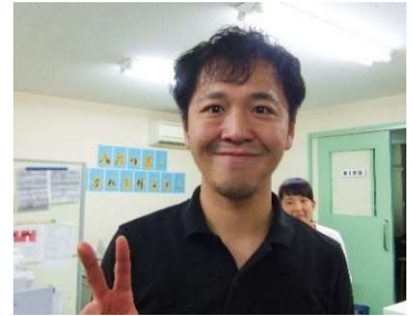
一見強面(コワモテ)?でも、実はと～っても優しいんです。

生徒たちに少しでもわかりやすい授業をしようと、とにかく授業準備に人一倍余念がありません。いつも机の前で教材、パソコンを開いて、授業準備をしています。