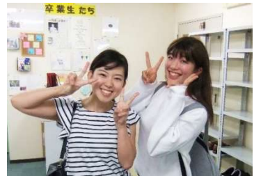
底抜けの明るさは相変わらず。