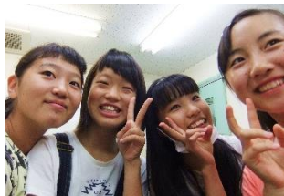
休憩時間、笑顔いっぱいの中3生

朝は4コマの「夏期講習」を受講して、昼から部活へ。 実はここからが大変なんです。WILLでは欠席した授業は全コマ補習があります。午後欠席した分の補習を受けるために、夜にまた塾へ来るんです。そして最終夜9時半まで再び勉強。