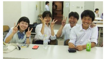
笑顔いっぱい3人と塾長

ほとんど打ち合わせなしのぶっつけ本番にもかかわらず、見事な受け答えには感心しました。