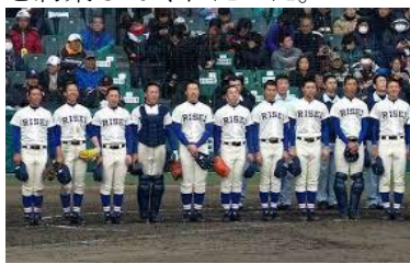
甲子園で勝って校歌を歌う R 高校ナイン

しかし、まさかの二度目の出場が翌年の春に決まった。本当に2回招待してくれたのだ。甲子園大会開会式の10日ほど前、M 君が塾を訪れてくれた。“塾長、必ずベスト8以上行きますよ”と約束してくれたのだ。