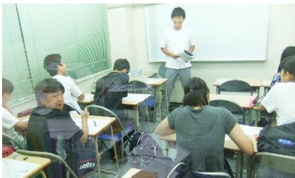
もちろん中2生だって…。

それもただイヤイヤ塾に来ているのではなく、とにかくみんな明るく通塾してくれています。そのみんなの笑顔を見ると、先生たちも本当にうれしく思っています。勉強もだんだん難しくなってきた大変だと思いますが、最後まで明るく頑張ってくださいね。