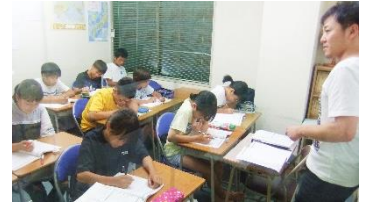
中1生も、頑張ってます！

特に中1生の夏期講習受講者は約8割。中2生もたくさんの生徒が夏期講習を受講してくれました。