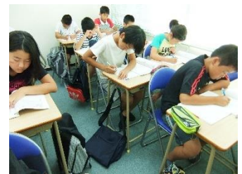
小学生だって頑張ってます～。

この夏休みの最後をかざるイベント。「ぶっ夏期」で鍛えた考える力を、存分に発揮してください。