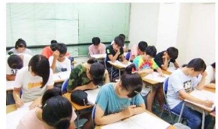
夏期講習での中3生の勉強の様子 勉強に取り組む姿勢が違いますね。