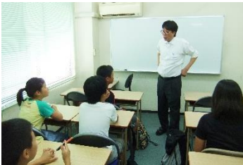
塾長の話に耳を傾ける小学生たち