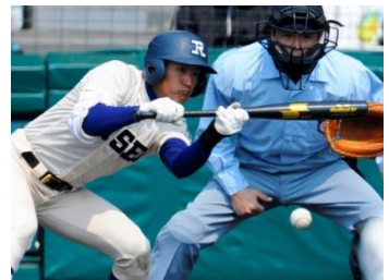
甲子園で見事に送りバントを決める M 君

しかしながら中学校時代に軟式野球の経験しかなかった M 君が R 高校で、しかも一年生でレギュラーを獲得し、その翌年一度目の甲子園出場を果たすとは誰が予想しただろうか。