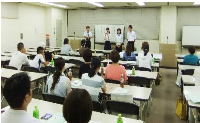
「第1回 保護者会」の様子

さて、当日は「皆様にご満足いただける内容だったのか?」「もっとわかりやすく説明できなかったのか?」等、様々な反省をしているところです。もし、私たちの話の中で、ご不明な点やご質問などがございましたら、ご遠慮なく、塾のほうまでお問い合わせください。個別にご説明し、お答えさせていただきたいと思っています。