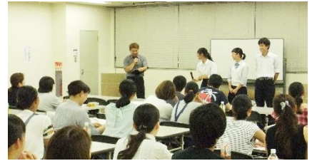
「高校入試説明会」の様子

7月2日(日)に「高校入試説明会」、7月9日に「第一回保護者会」を開催いたしました。お忙しい中、ご来場くださいましたご父兄の皆様、あらためて御礼申し上げます。本当にありがとうございました